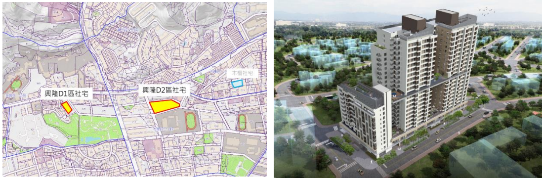
圖4 基地位置及現況示意圖