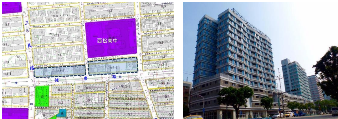
圖3 基地位置及建築模擬示意圖