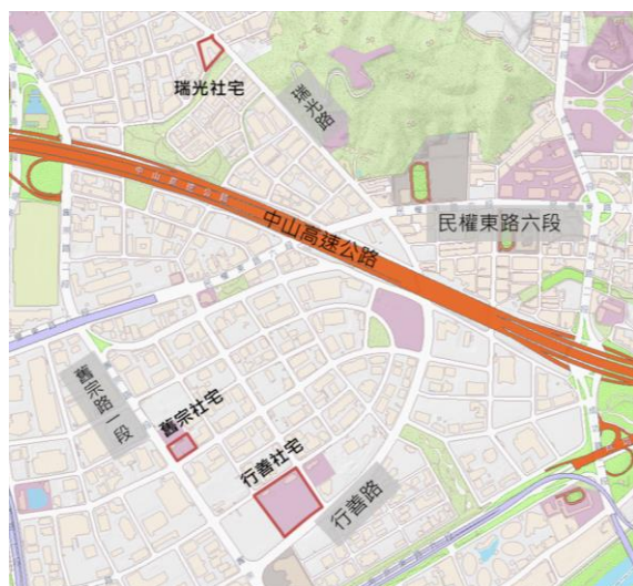
圖1 基地位置及建築模擬示意圖