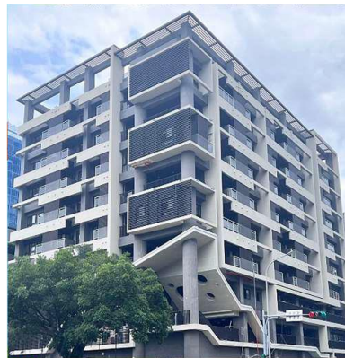
圖6 基地位置及現況示意圖