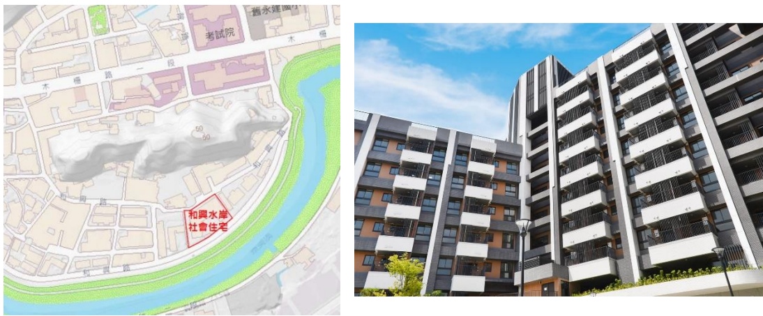
圖5 基地位置及現況示意圖