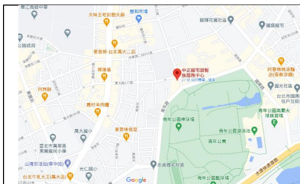
中正國宅基地位置