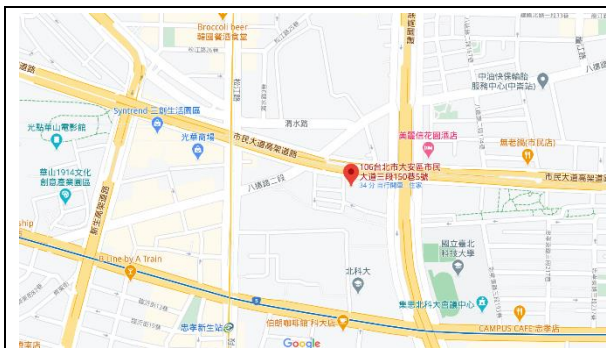
懷生國宅基地位置

懷生出租國宅座落於大安區市民大道三段150巷5號，共計4棟，為屋齡17年，地上13層，地下2層共計205戶之建築物，採擴柱補強工法。