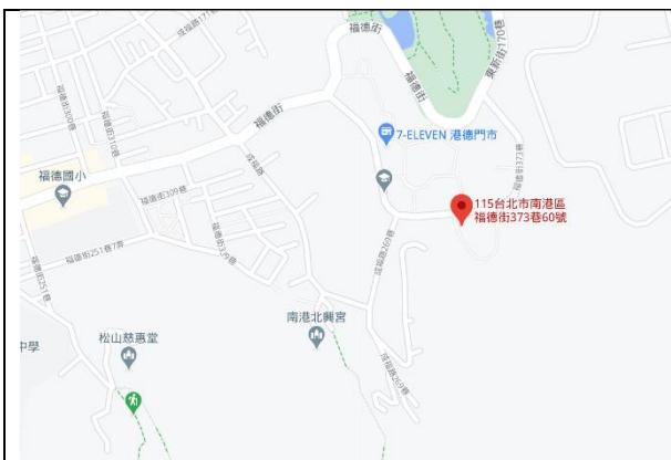
南港國宅基地位置